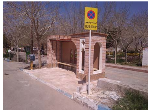
تصاویر ایستگاه مینی بوس در شهرستان بشویه