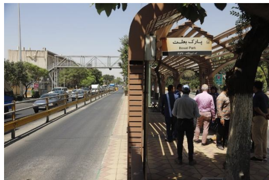
(تصاویر ایستگاه بعثت؛ همشهری آنلاین، کد خبر: ۶۹۱۸۳۶)

در اینجا مطلوب است پیرو تاثیر نگاه مدیریتی به عنوان اولین گام در ایجاد تغییرات مثبت، به گوشه‌ای صحبت‌های آقای "سید مرتضی روحانی" شهردار منطقه ۱۶ تهران درباره‌ی اهمیت اجرای پروژه‌هایی که اصول معماری اصیل ایرانی در آن رعایت می‌شود، اشاره نمود. به گفته ایشان، "ما هر قدر در ساخت و ایجاد بناهای شهری به فرهنگ اصیل ایرانی و اسلامی توجه داشته باشیم به همان اندازه در حفظ و صیانت از آن ارزش‌ها تأثیرگذار خواهیم بود، حال این معماری می‌تواند مربوط به ساختمان و بنایی بزرگ باشد و خواه ایستگاه اتوبوس و یا هر مکان دیگر. این پروژه چند نکته کلیدی و طلایی دارد. اول اینکه نمایی از معماری ایرانی و اسلامی را به زیباترین شکل ممکن به تصویر کشانده و نگاه هر رهگذر و مسافری را به