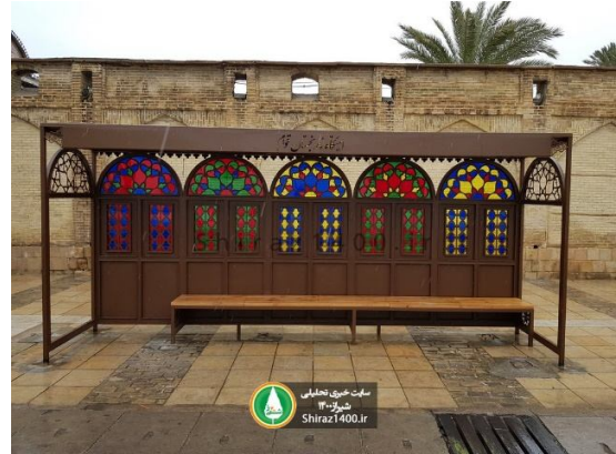
تصاویر ایستگاه اتوبوس شیراز