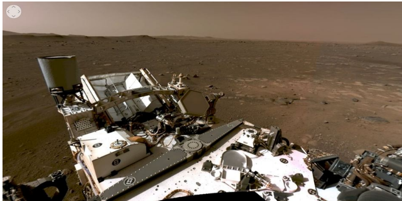
نمونه یک عکس ۳۶۰ درجه که توسط مریخ نورد استقامت ۱۶ ناسا تهیه شده است.

اما امروزه کشورهای جهان در پی ایجاد نوع تازه‌ای از موزه هستند. این نوع موزه‌ها که موزه دیجیتال نام دارد، این موزه‌ها به صورت چند بعدی در فضای مجازی افتتاح می‌شود و ساختاری متشکل از عکس‌های دو بعدی که در کنار یک‌دیگر به محیطی سه بعدی تبدیل می‌شوند، تشکیل شده است. به عبارتی موزه دیجیتال مکانی چند بعدی است که به صورت صوتی، تصویری و متنی بر روی فای شبکه اینترنت به ارائه خدمات، اطلاعات و آموزش در زمینه‌های گسترده فرهنگی و تاریخی در راستای فعالیت‌ها و اهداف یک موزه واقعی می‌پردازد. (Steinmann, ۲۰۰۴, Pietsch www) این موزه‌ها علاوه بر اینکه می‌توانند برای افرادی که به موزه‌های مشهور دسترسی ندارند مفید باشند و دیگر افراد را به تماشای موزه‌ها تشویق کنند، دارای اطلاعات، آموزش، سخنرانی، انتشارات و فعالیت‌های گوناگون علمی هستند که به نوبه خود نوعی حفاظت از این آثار کهن و ارزشمند است. آشنایی با این موزه‌ها باعث می‌شود تا بهتر از آن‌ها بهره بگیریم و در راستای حفاظتی از ارزش‌های میراث فرهنگی کشورمان ایران بکوشیم. این نوع موزه‌ها اسامی مختلفی دارند. موزه مجازی ۸ ، موزه الکترونیکی ۹ ، موزه بدون دیوار ۱۰ ، موزه آنلاین ۱۱ و موزه خیالی ۱۲ از دیگر نام‌های موزه دیجیتالی هستند. این موزه‌ها با کمک فناوری‌های نوینی همچون گروه ابزار ۱۳ ، زبان واقعیت مجازی ۱۴ ، فیلم-های n-بعدی، عکس‌های ۳۶۰ درجه ۱۵ و کنترل هوشمند دوربین ایجاد می‌شوند.