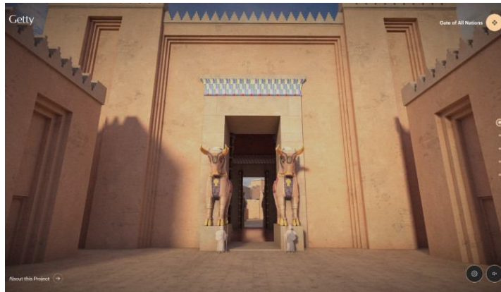
نمایی از بازسازی دیجیتالی تخت جمشید، موزه دیجیتالی گتی