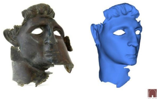
بازسازی دیجیتالی چهره حاکم سلوکی (سمت راست) در برابر آثار به جا مانده از چهره او (سمت چپ)

۳- بازسازی پیکره مفرغی یک حاکم دوره سلوکی