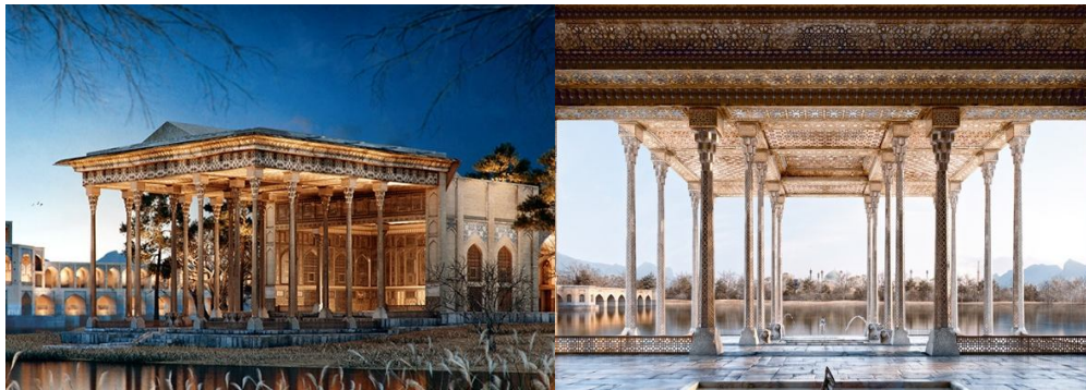
تصاویر بازسازی شده از کاخ آینه اصفهان