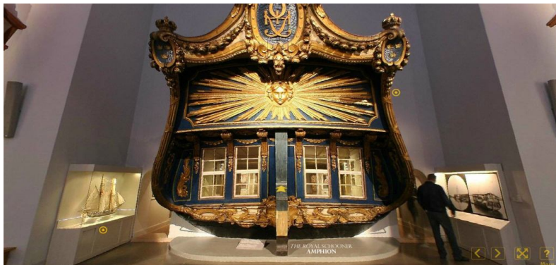
موزه بین‌المللی دریایی سوئدان ۱۷

این موزه‌ها شامل محدودیت‌هایی هستند. این موزه‌ها برای همگان در دسترس نخواهند بود، زیرا وسایل ارتباطی لازم و حتی اینترنت در کشورهای جهان سوم با سرعت و وجود هزینه‌های مختلف و حتی محدودیت‌های دسترسی وجود دارد. برای برخی کشورها تولید و ساخت همچنین موزه‌هایی به شدت زمان‌بر و شامل هزینه‌های زیادی است که باعث می‌شود برای موزه‌های که پشتوانه مالی لازم را ندارند، ساخت یک نسخه دیجیتالی از موزه برایشان غیرممکن باشد. در آخر این اطلاعات به دلیل قرار گرفتن بر شبکه اینترنت ممکن است دچار تحریف، انحراف، دستکاری و یا دزدی شود که این امر نیز یک مسئله خطرناک و حساس برای صاحبان این موزه‌ها می‌باشد.