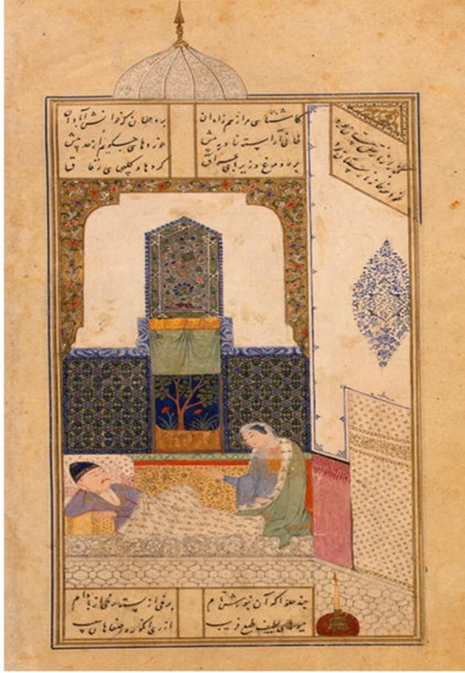
نگاره ۲: دوره صفوی ۱۵۲۴م / ۹۳۱ه.ق