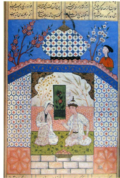
نگاره ۳: مکتب بخارا، ۱۵۷۸م / ۹۸۶ه.ق