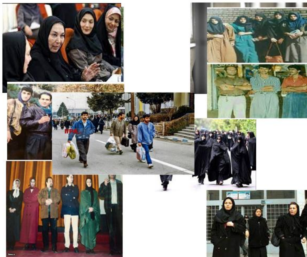
اعتماد آنلاین/ایران ناز/بو خط نیوز/روز پلاس/پرتوین ها

پوشاک زنان بعد از انقلاب اسلامی ایران پوششی کامل که به نام حجاب که ارزشی اساسی برای حفظ مصونیت اخلاقی و روانی زن به هنگام حضور در عرصه های گسترده علمی اجتماعی، سیاسی، اقتصادی و هنری و... جلوه می کند و می درخشد. حجاب پوشش برازنده زن مسلمان معتقد است که بهترین شاخصه های فرهنگ ملی و دینی ملل مسلمان قلمداد می شود، لباسی که نه تنها به جاذبه های ظاهری زن، دامن نمی زند که جلوه های صوری او را میپوشاند تا خصوصیات انسانی او تجلی روشن تری بیابد و هویت نقش آفرین او را بهتر بنمایاند.