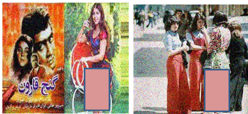
www.TehranAlef.ir / رسانه اختصاصی مد ایران /

از آنجایی که با توجه به تحقیق و مطالعه و بررسی عکس ها به موضوع لباس زنان در فیلم ها که تقلید از هنر پیشگان در هر دوره منجر به تغییر مد در لباس و پوشاک زنان در هر دوره می توان اشاره کرد از آنجایی که در اواخر دهه ی ۴۰ و اوایل ۵۰ شمسی سبک هیپی در پوشش ایرانیان در این دوره به وضوح دیده میشود، این سبک هیپی گری از موی ژولیده، پیراهن مردانه و شلوار جین دم پاگشاد که پوشش جوانان این میتوان در لباس های جوانان که تاثیر گرفته از فرهنگ جهان از راه موسیقی، فیلم، تلویزیون که ارتباط مستقیم با فرهنگ و هنر در دوره به حساب می آید.