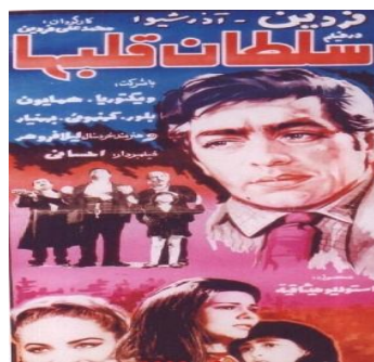
فیلم قیصر ۱۳۴۸ محصول آریا فیلم / فیلم سلطان قلبها ۱۳۴۷ محصول آذر شیوا