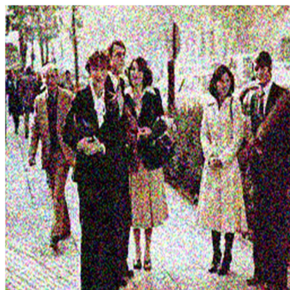
www.tasim news.com/ خبر گذاری تسنیم