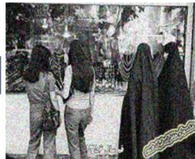
(نشریه، ۵ اصغر/حجاب خوب، حجاب بد)/مجله اقیانوس آبی/لباس محلی کردستان